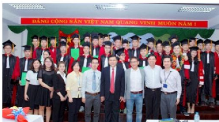
Lễ tốt nghiệp của sinh viên CTTT năm 2016