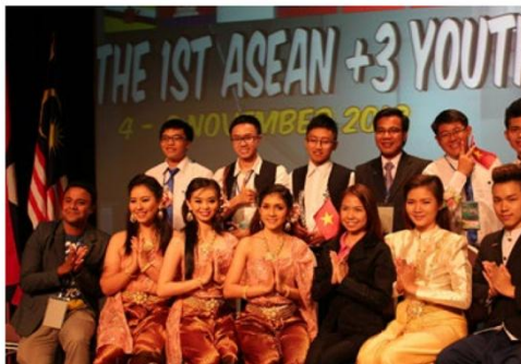
Đại diện SV CTTT giao lưu quốc tế tại Malaysia 2013