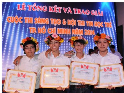
Olympic Tin học Sinh viên Việt Nam Đạt nhiều giải thưởng qua nhiều năm