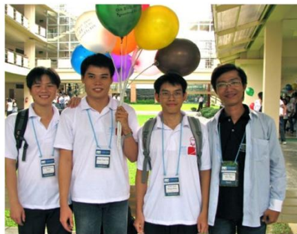
Đội tuyển duy nhất của Việt Nam được chọn tham dự ACM/ICPC World Final ở Cáp Nhĩ Tân, Trung Quốc (02/2010)