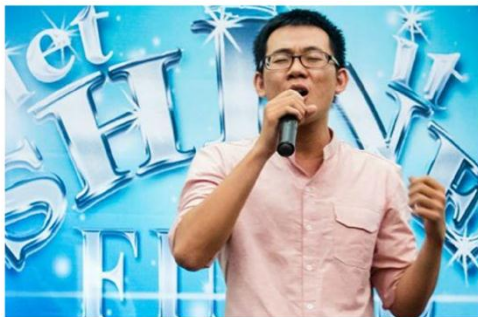
Cuộc thi Let it shine 2014