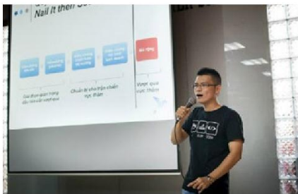
Hoạt động APCS TechTalk giới thiệu và chia sẻ kiến thức về các kỹ thuật và công nghệ mới nhất