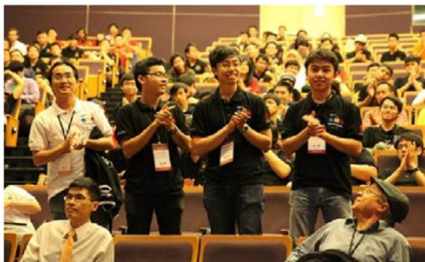
Đội tuyển HCMUS-Shine tham dự ACM/ICPC World Final tại Thái Lan (2016)