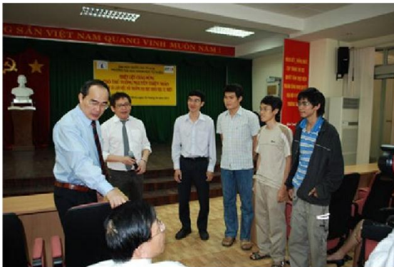
Phó thủ tướng Nguyễn Thiện Nhân nói chuyện với một số sinh viên tiêu biểu của CTTT năm 2011

Chương trình đào tạo Tiên tiến ngành Công nghệ Thông tin của trường Đại Học Khoa Học Tự Nhiên (ĐHQG-HCM) là một trong mười chương trình đầu tiên được Bộ Giáo dục và Đào tạo phê duyệt và giao nhiệm vụ triển khai đào tạo theo đề án “Đào tạo theo chương trình tiên tiến tại một số trường đại học của Việt Nam giai đoạn 2008-2015” (theo quyết định số 1505/QĐ-TTg của Thủ tướng Chính Phủ) nhằm thực hiện nhiệm vụ “tiếp thu có chọn lọc và đào tạo một số chương trình và giáo trình tiên tiến hiện đại đang giảng dạy ở các trường Đại học nước ngoài phù hợp yêu cầu phát triển của Việt Nam” .