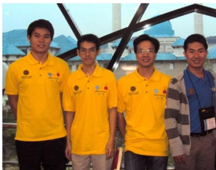
Đội tuyển duy nhất của Việt Nam được chọn tham dự ACM/ICPC World Final ở Orlando, Hoa Kỳ (05/2011)