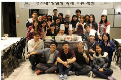
Đại diện SV CTTT tham gia chương trình trao đổi sinh viên tại Hàn Quốc trong 1 năm