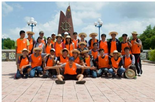
Hoạt động team-building cho toàn thể sinh viên (10/2014)