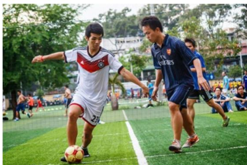
Hoạt động thể dục thể thao APCS Cup