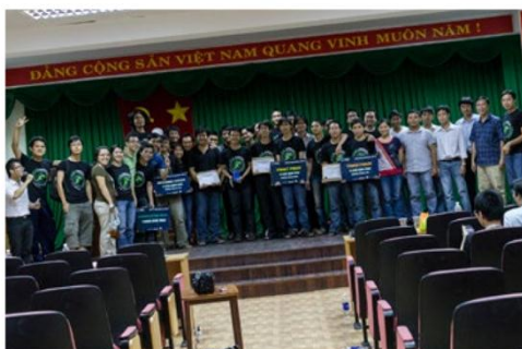
Tổ chức cuộc thi APCS Hackathon 2012