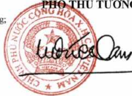
Vũ Đức Đam

TM. CHÍNH PHỦ KT. THỦ TƯỚNG PHÓ THỦ TƯỚNG